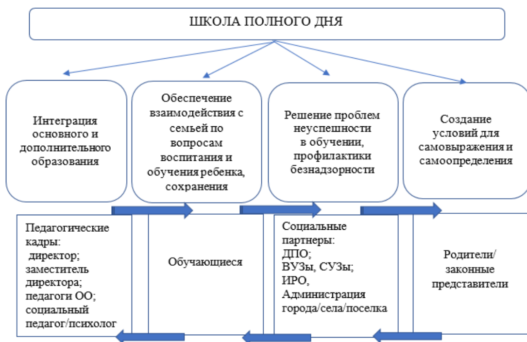
Рис. 3. Модель «Школа полного дня», г. Владивосток

Модель Школы полного дня, представленная педагогическим сообществом г. Владивостока, разработана в формате организационной структуры учреждения, функционирующего в режиме полного дня (рис. 3). Элементами структуры являются участники образовательных отношений, которые осуществляют совместно организованную деятельность, и базовые направления развития организации как школы нового типа. Наряду с традиционными направлениями (интеграция общего и дополнительного образования, обеспечение взаимодействия образовательной организации с семьей) обозначены специфические векторы развития, направленные на решение проблем, актуальных для конкретной образовательной организации (проблема неуспешности обучения, профилактики безнадзорности и создание условий для самовыражения и самоопределения).