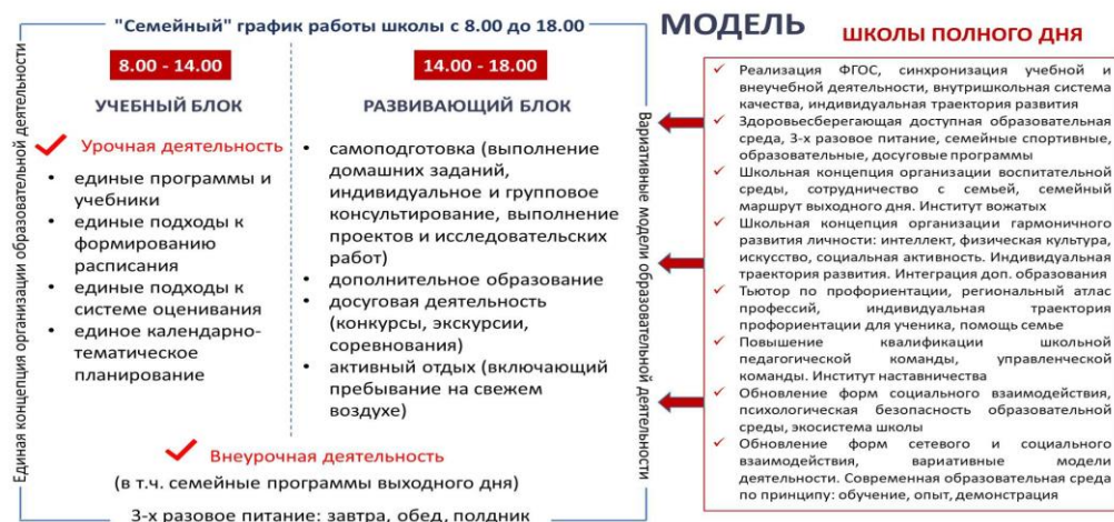
Рис. 1. Универсальная модель Школы полного дня

вательной деятельности (дополнительное образование, досуговая деятельность, самоподготовка, активный отдых). Данная модель представляет общие подходы к организации деятельности ШПД, что определяет ее универсальный характер.