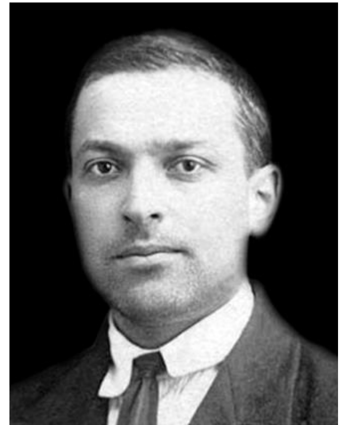
Л.С. Выготский 1896-1934