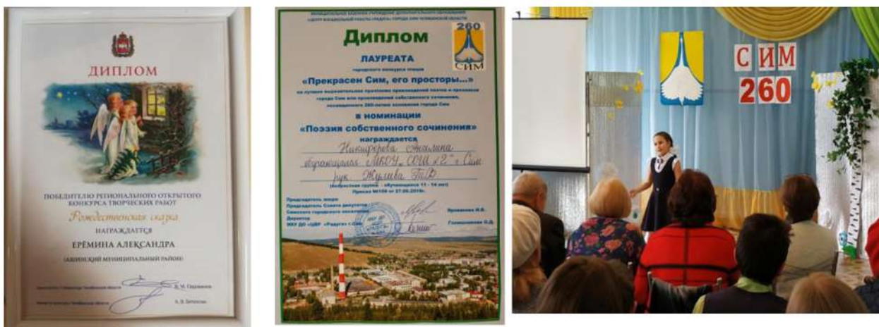
Рис. 9. Конкурс творческих работ «Рождественская сказка». Конкурс чтецов «Прекрасен Сим, его просторы...»

Муниципальный конкурс краеведческих творческих работ «Крепка семья — сильна Россия». https://sch2simasha.educhel.ru/about/news/1389638