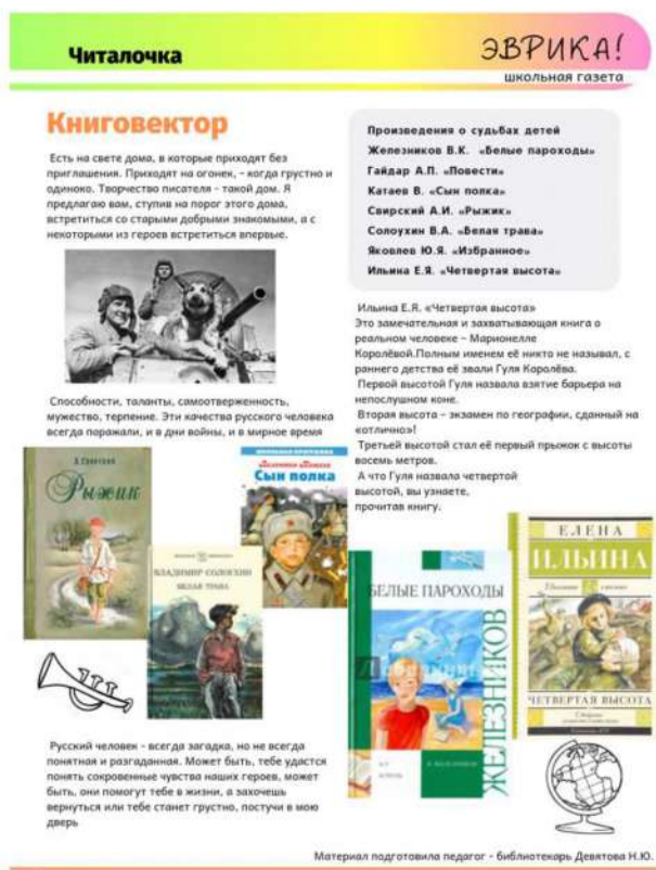
Рис. 4. Страница школьной газеты

Библиотека работает в тесном сотрудничестве со школьным пресс-центром выпускающим школьную газету «Эврика» https://sch2simasha.educhel.ru/about/news/page/13