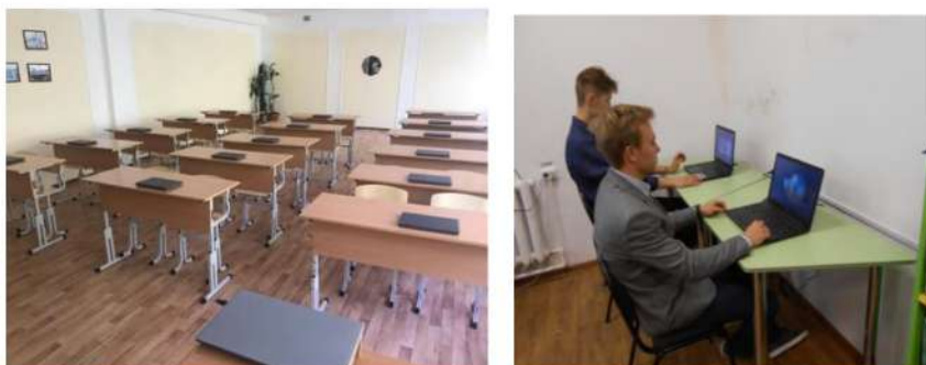
Рис. 7. Зона получения информационных ресурсов

Зона хранения и демонстрации культурного наследия включает в себя: