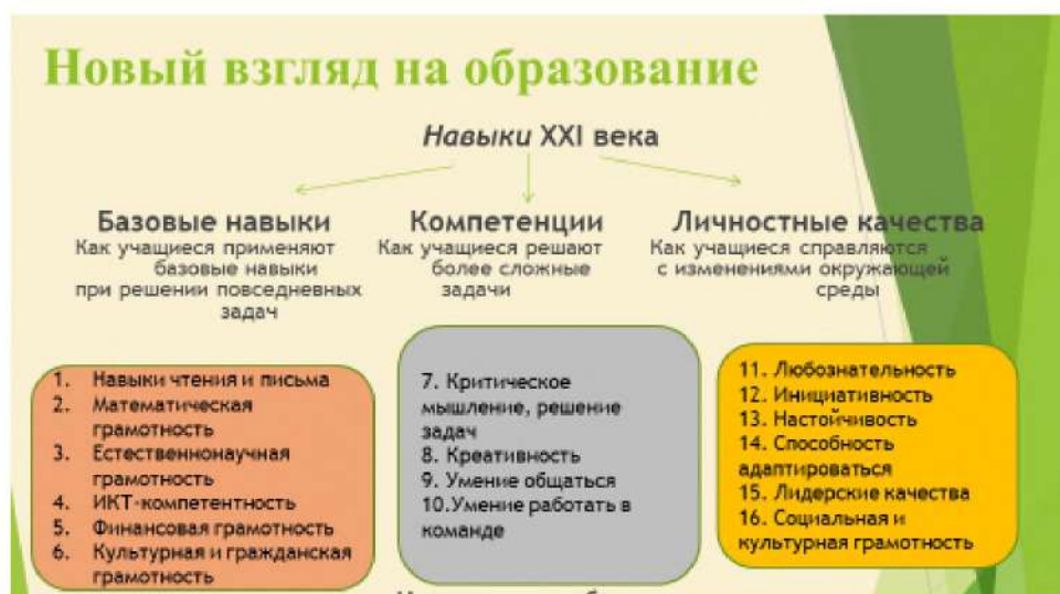
Рис. 1. Навыки XXI века

В Национальном проекте «Образование» прописаны навыки XXI века для обучающихся.