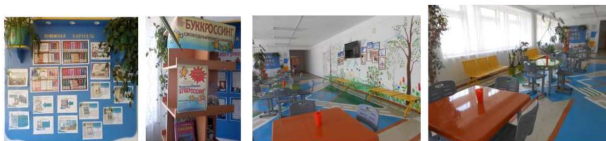
Рис.5. Рекреационная зона

Здесь же предусмотрено место для буккроссинга, где любой читатель может взять понравившуюся книгу, разумеется, совершенно бесплатно. Берешь, читаешь книгу, приносишь обратно, и ее берет следующий читатель.