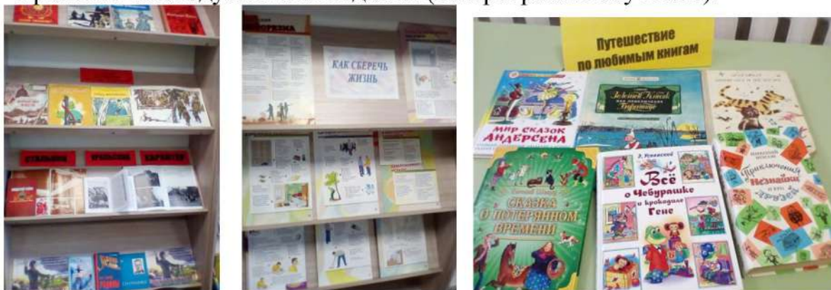
Рис. 8. Книжные выставки

- хранения многодублетных изданий (по программе обучения).