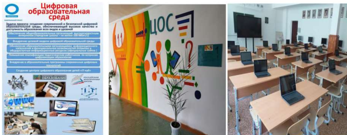
Рис. 6. Презентационная зона

- проведения литературных гостиных, организации работы дискуссионных клубов, «библиотечных уроков» гражданско-патриотической направленности