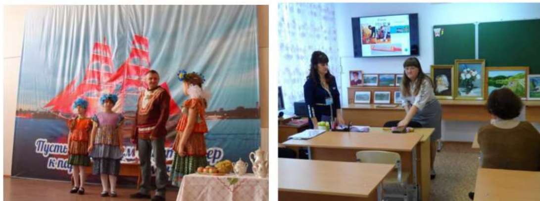
Рис. 11. Результаты дополнительного образования

Объединения дополнительного образования «В гостях у сказки», «Редколлегия школьной газеты», «Художественное слово» работали и в дистанционном формате https://sch2simasha.educhel.ru/about/news/1607544