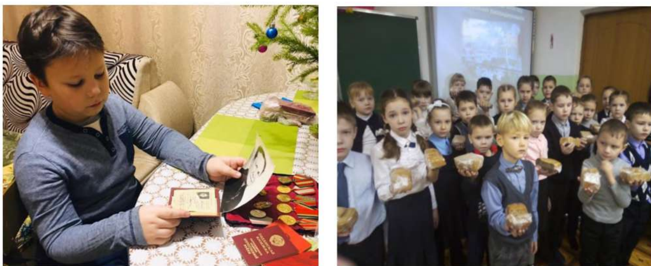
Рис. 10. Акция «Блокадный хлеб»

https://sch2simasha.educhel.ru/activities/75pobeda/post/633622