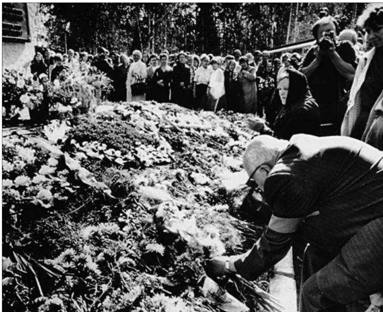
Фотография 1. Золотая гора, Челябинск. Сахаров возлагает цветы к закладному камню. 1989 г.

Задание 4. Используя дополнительные источники информации, расскажите на уроке, чем важен мемориал «Золотая гора» для современников? Как в 1980-е гг. собирались использовать территорию, на которой находится комплекс?