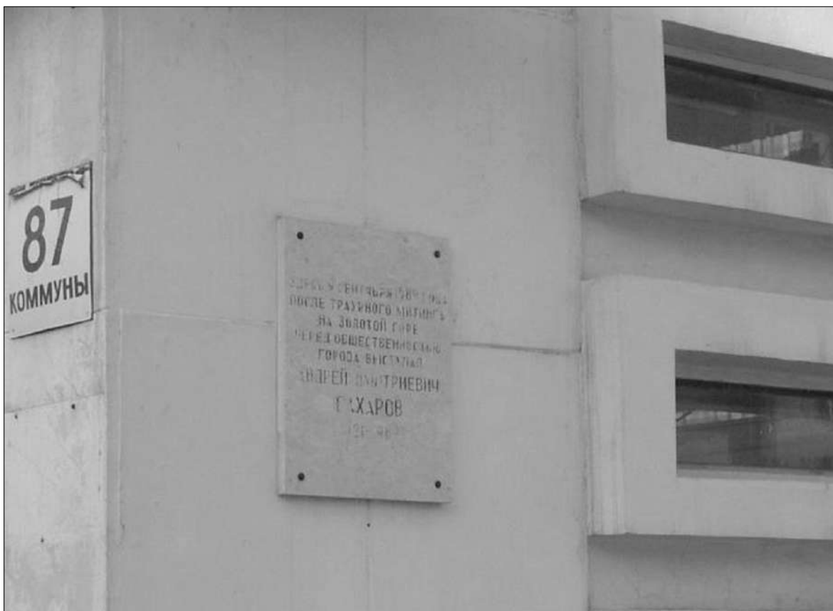
Фотография 5. Мемориальная доска правозащитнику, академику А. Д. Сахарову.