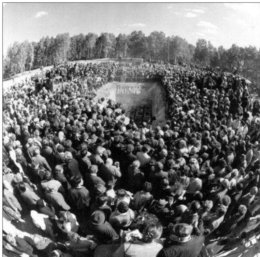
Фотография 3. Траурный митинг в Челябинске 9 сентября 1989 г.