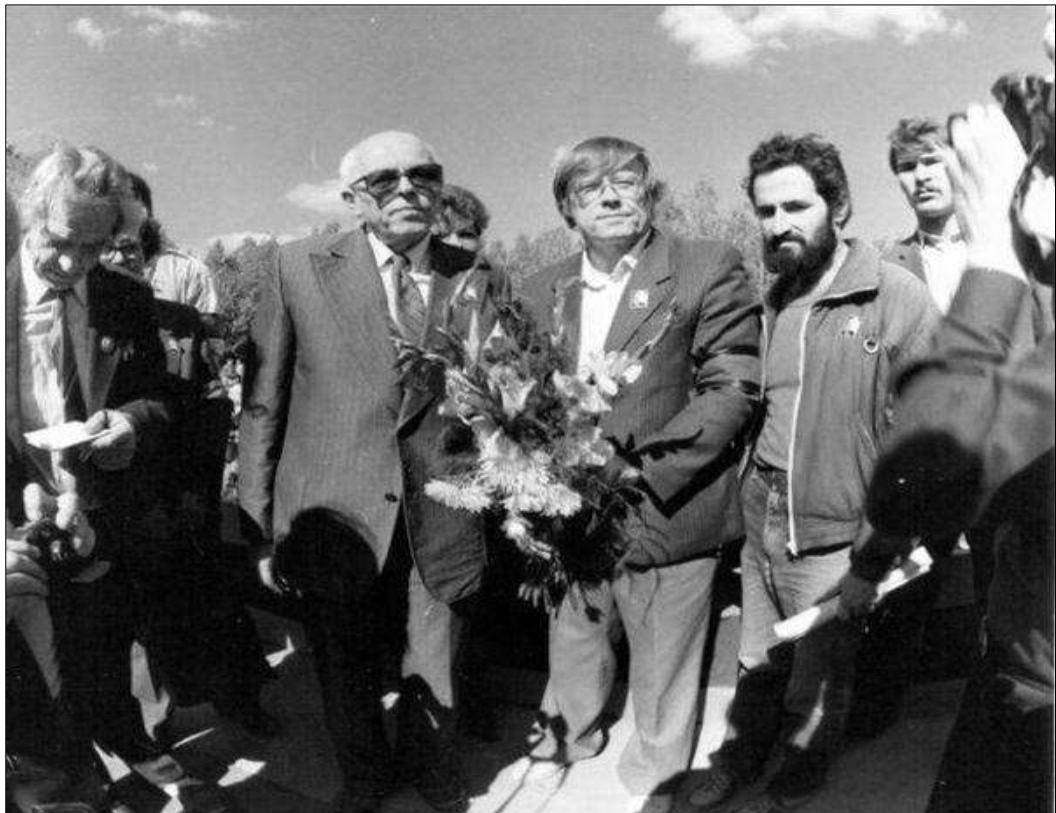
Фотография 2.