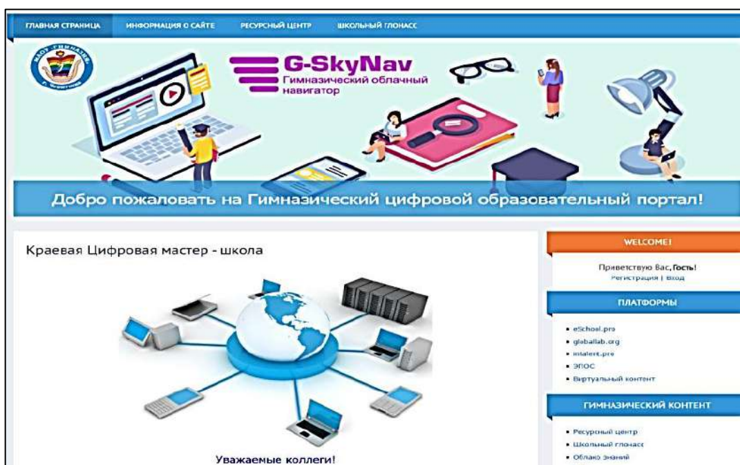
Рис. 2. Гимназический цифровой образовательный портал

С главной странички официального сайта гимназии ( https://biblio59.usite.pro/ ) мы приглашаем войти в новое гимназическое цифровое пространство.