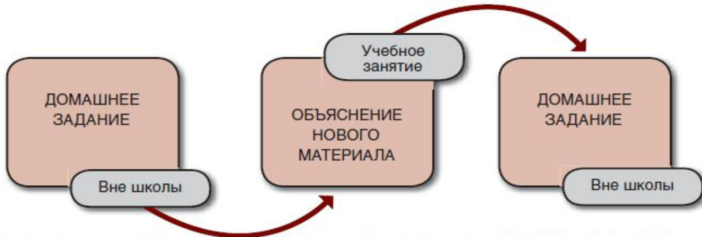
Рис. 1. Традиционная модель организации учебного занятия в общем (школьном) образовании