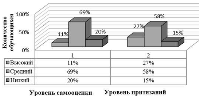
Рис. 2. Результаты исследования по методике измерения самооценки и уровня притязаний (Т.В. Дембо, С.Л. Рубинштейн)

Результаты исследования по данной методике представлены в рисунке 2.