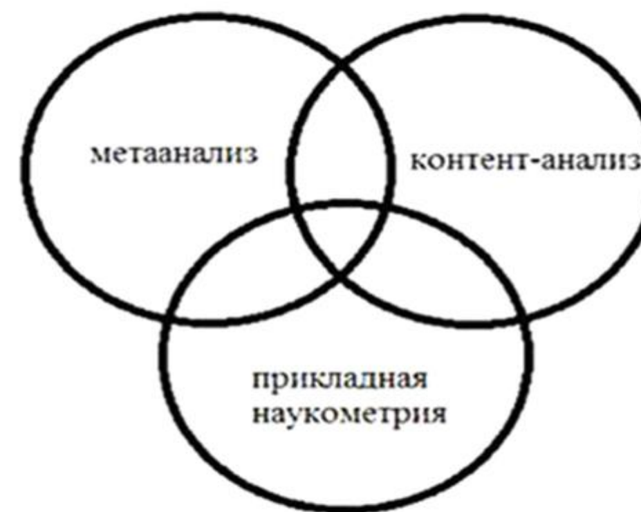
Рис. 2. Схема комплексного использования метаанализа, прикладной наукометрии и контентанализа

Метаанализ решает ряд наукометрических задач и пересекается по смыслу с контент-анализом. Он может включать в себя как элементы прикладной наукометрии, так и количественного и качественного контент-анализа (рис. 2).