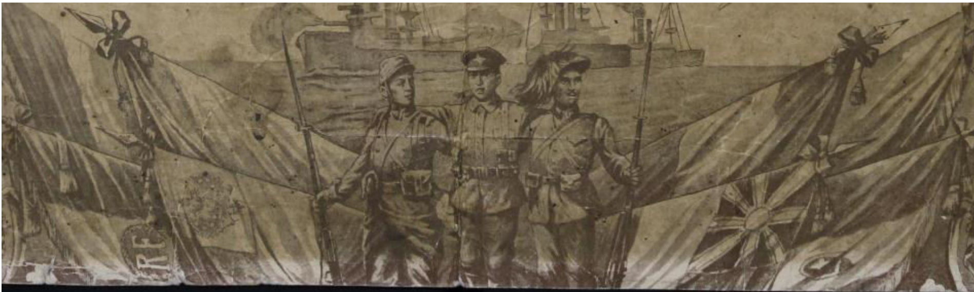
Антанта. Французская открытка. 1916 год // Родина. 2017. № 2. С. 35