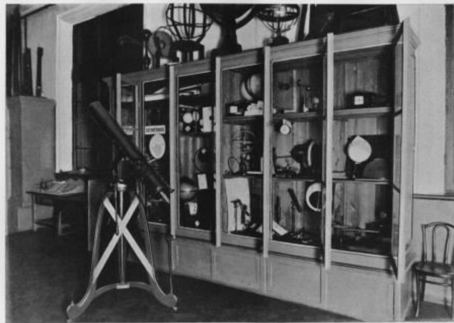
Изъ коллекцій по космографіи и метеорологіи.