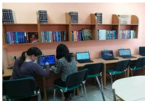
Рис.2 Подготовка учителей к урокам.