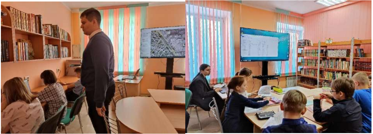
Рис.4 Занятия по внеурочной деятельности.