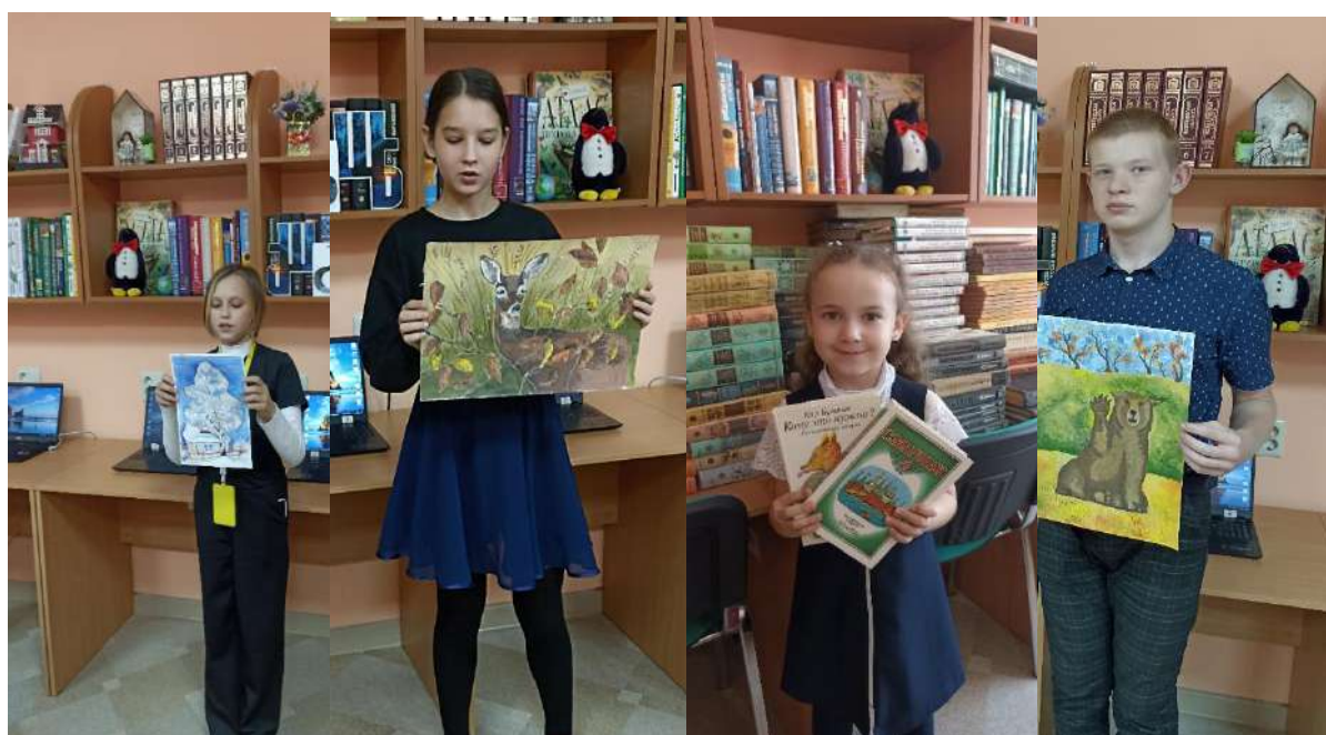
Рис.7 Конкурс «Рисуем любимые книжки и рассказываем о них».