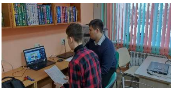
Рис.3 Работа наставников со школьниками.