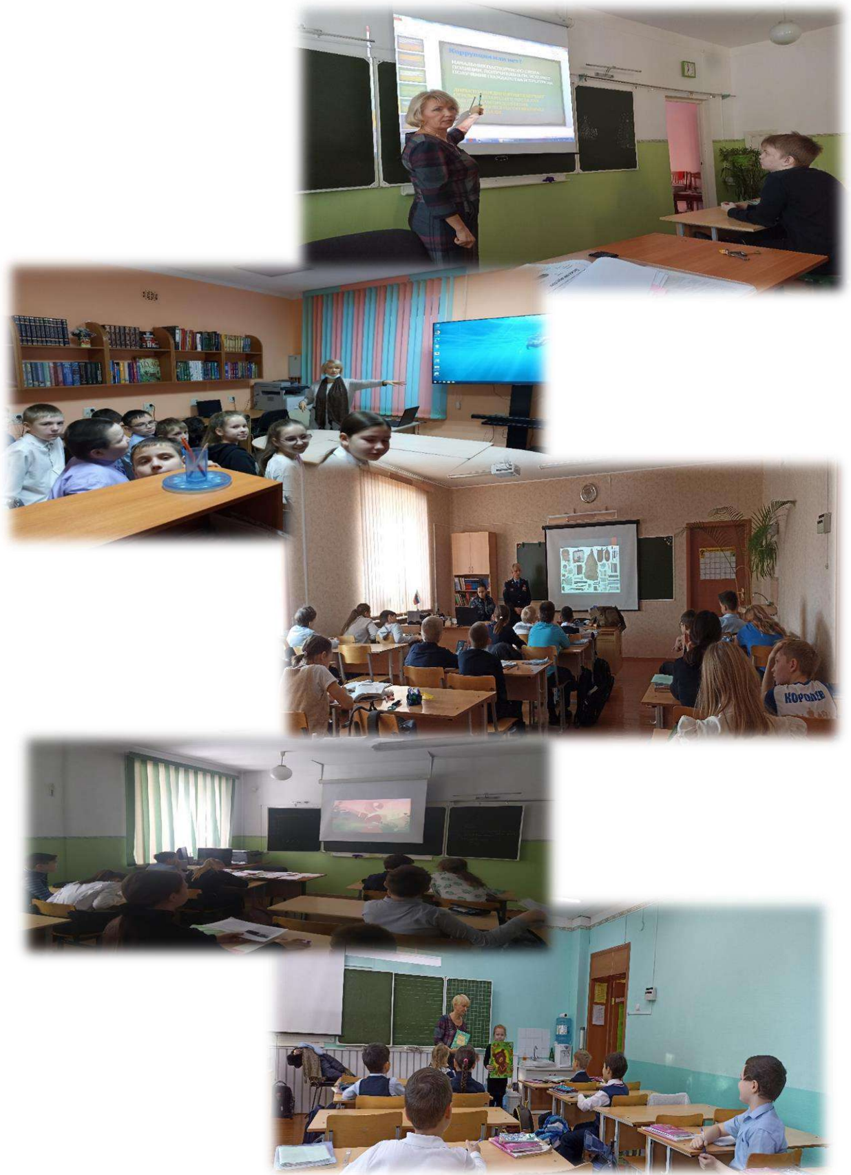
Рис.10. При ограниченном пространстве ШИБЦ «раздвигает» границы и «идёт» в аудитории.