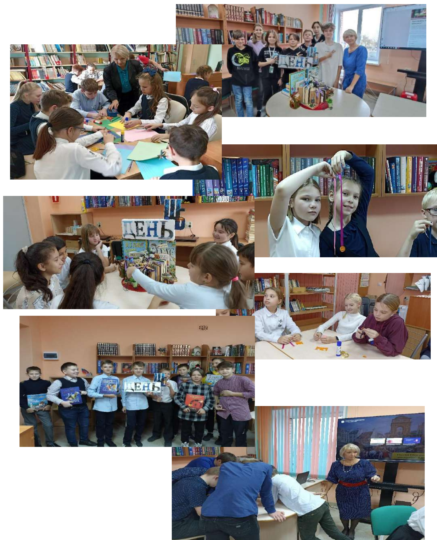
Рис.9. Празднование Международного Дня школьных библиотек.