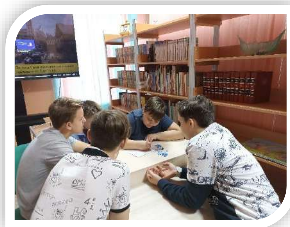
Рис.6. Фотографии библиотечных мероприятий. Моменты командной работы на конкурсах; брэйн-ринги и «мозговые» штурмы.