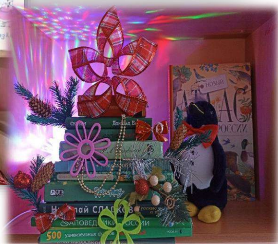
Рис. 11. Интерактивные выставки к юбилейным событиям, праздникам с использованием инсталляции и мультимедиа.