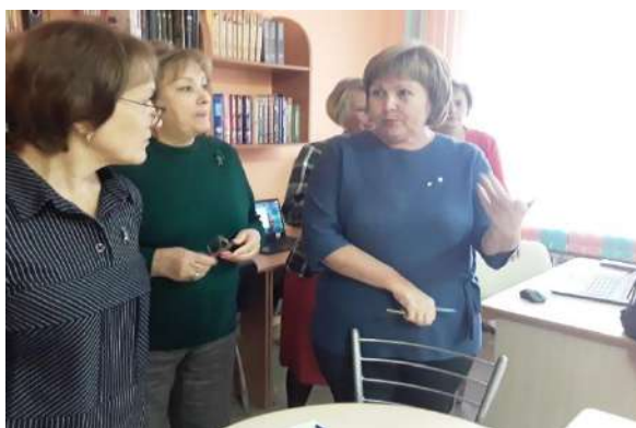
Рис.1 Заседание школьного МО.