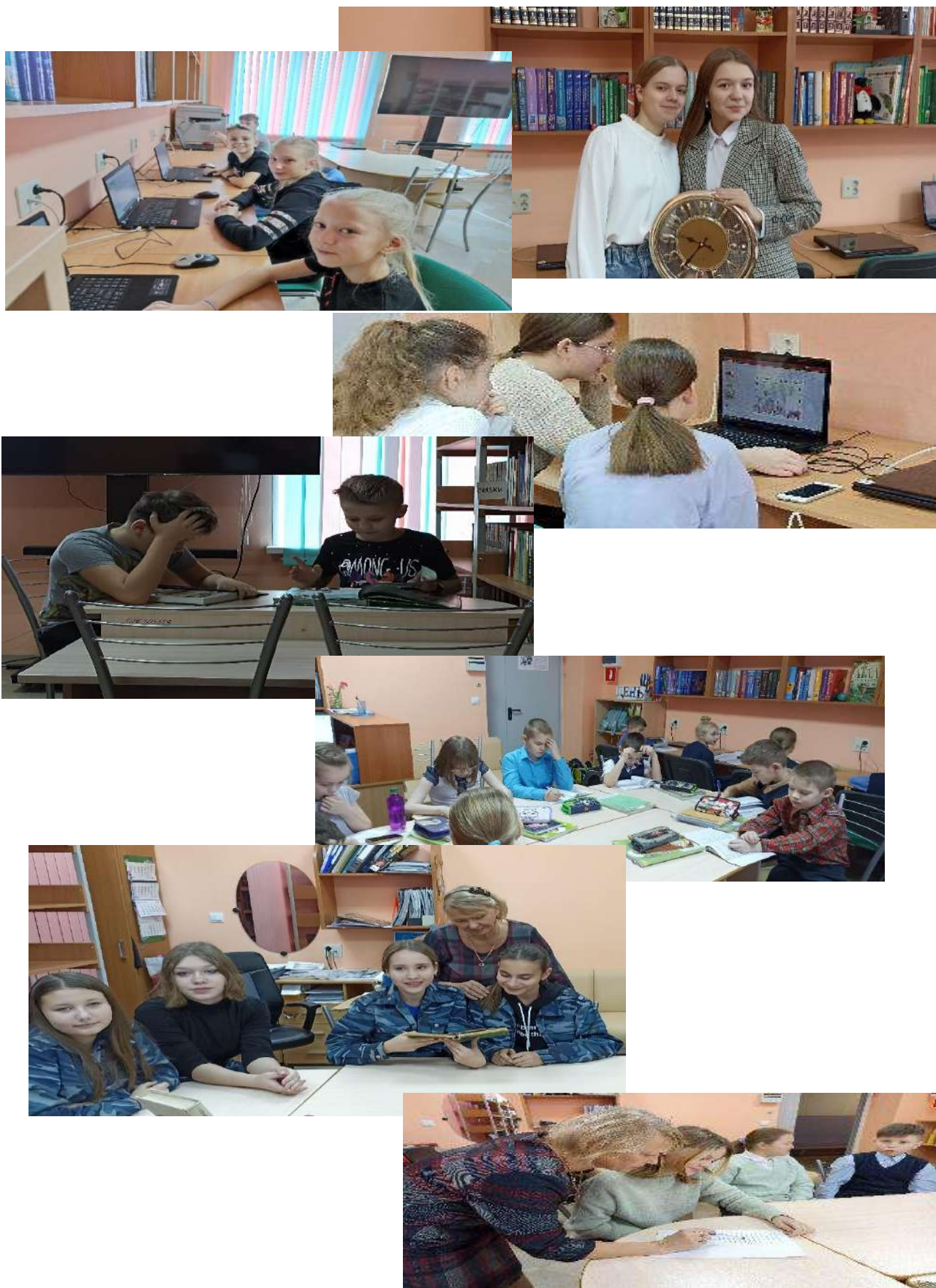
Рис.8 ШИБЦ – место, где можно встретиться с друзьями, сделать проект, подготовиться к урокам, почитать книги и обсудить интересную информацию.