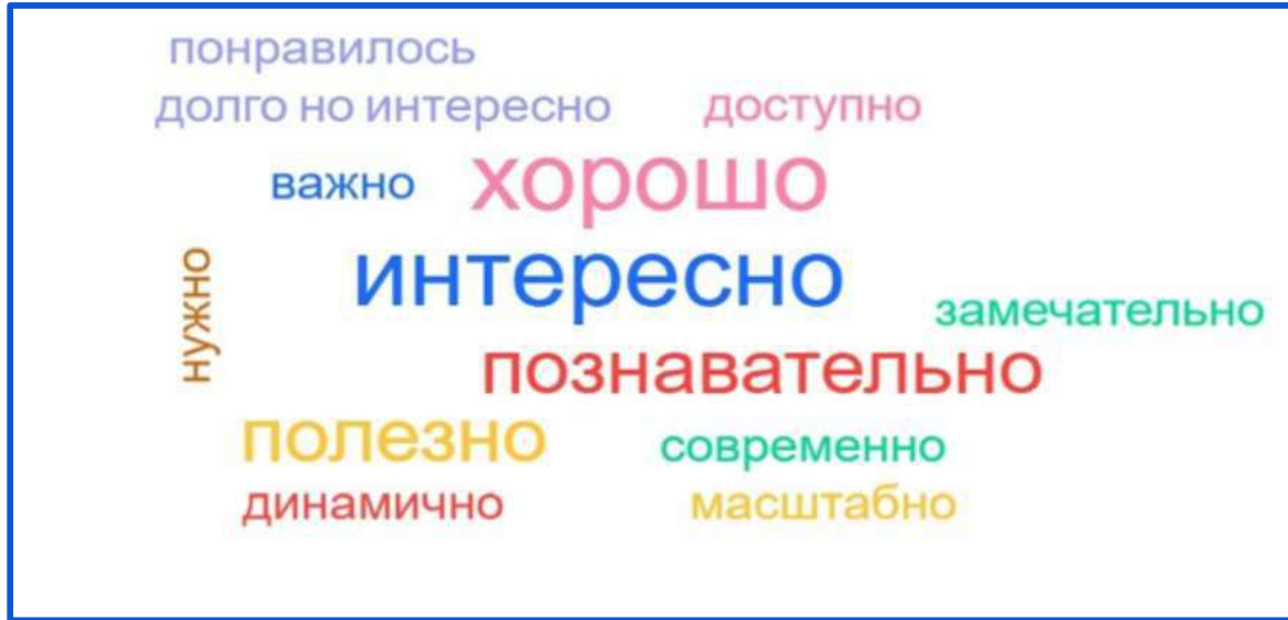
“Облако слов” слушателей (Образовательный интенсив для педагогов и руководителей)