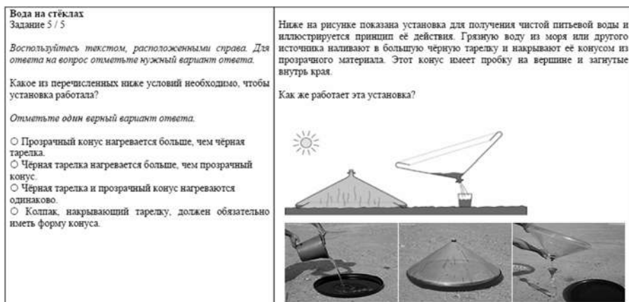
Рис. 5. Пятое задание тренировочного тура