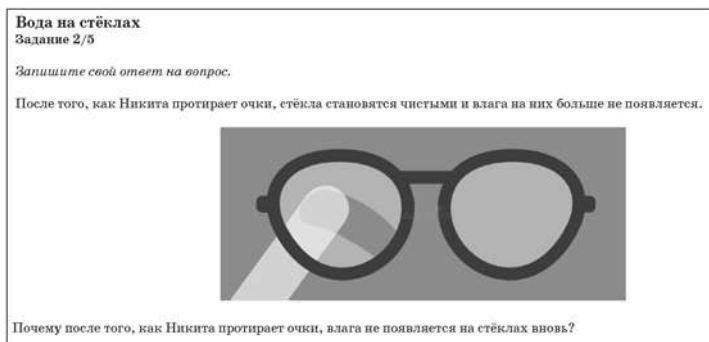
Рис. 2. Второе задание тренировочного тура