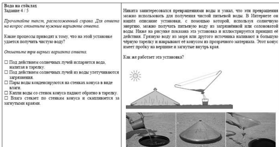
Рис. 4. Четвёртое задание тренировочного тура