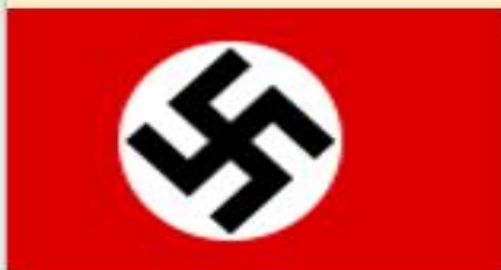
Флаг со свастикой

- пропаганда и публичное демонстрирование нацистской атрибутики или символики либо атрибутики или символики, сходных с нацистской атрибутикой или символикой до степени смешения, либо публичное демонстрирование атрибутики или символики экстремистских организаций;