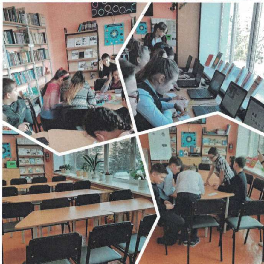
Занятия по информационной культуре в ШИБЦ