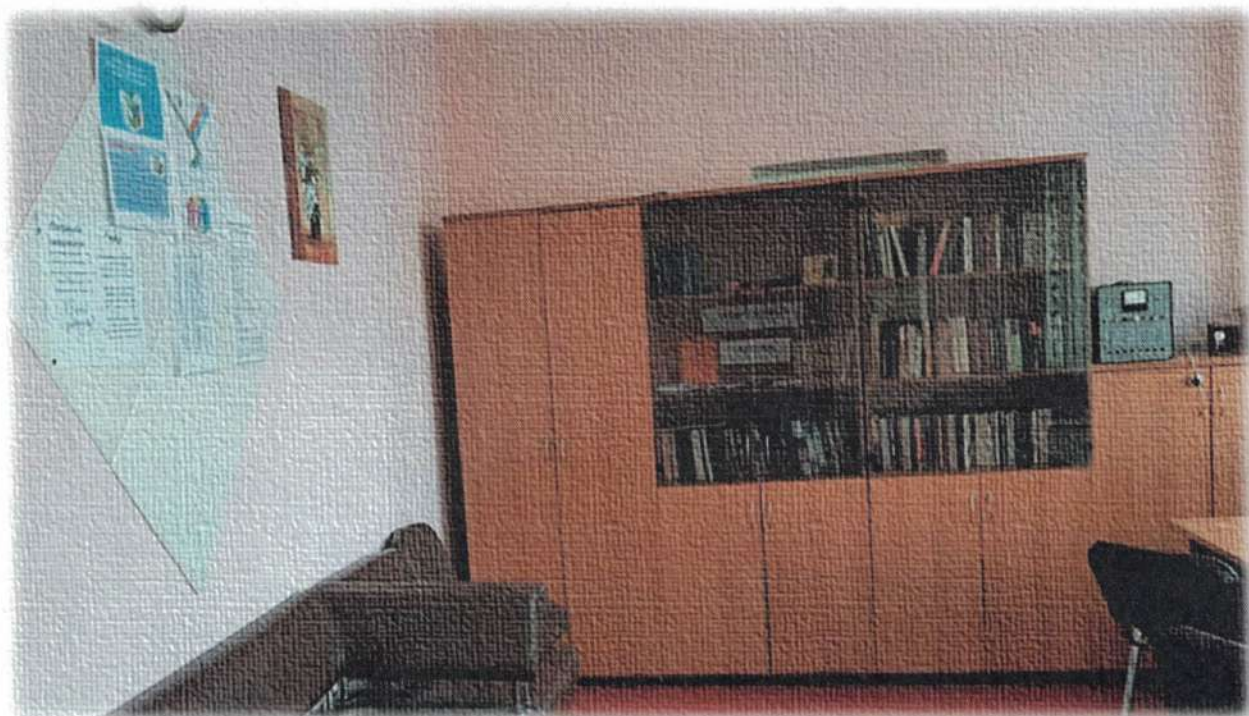
Буккроссинг (свободный книгообмен) в Учительской