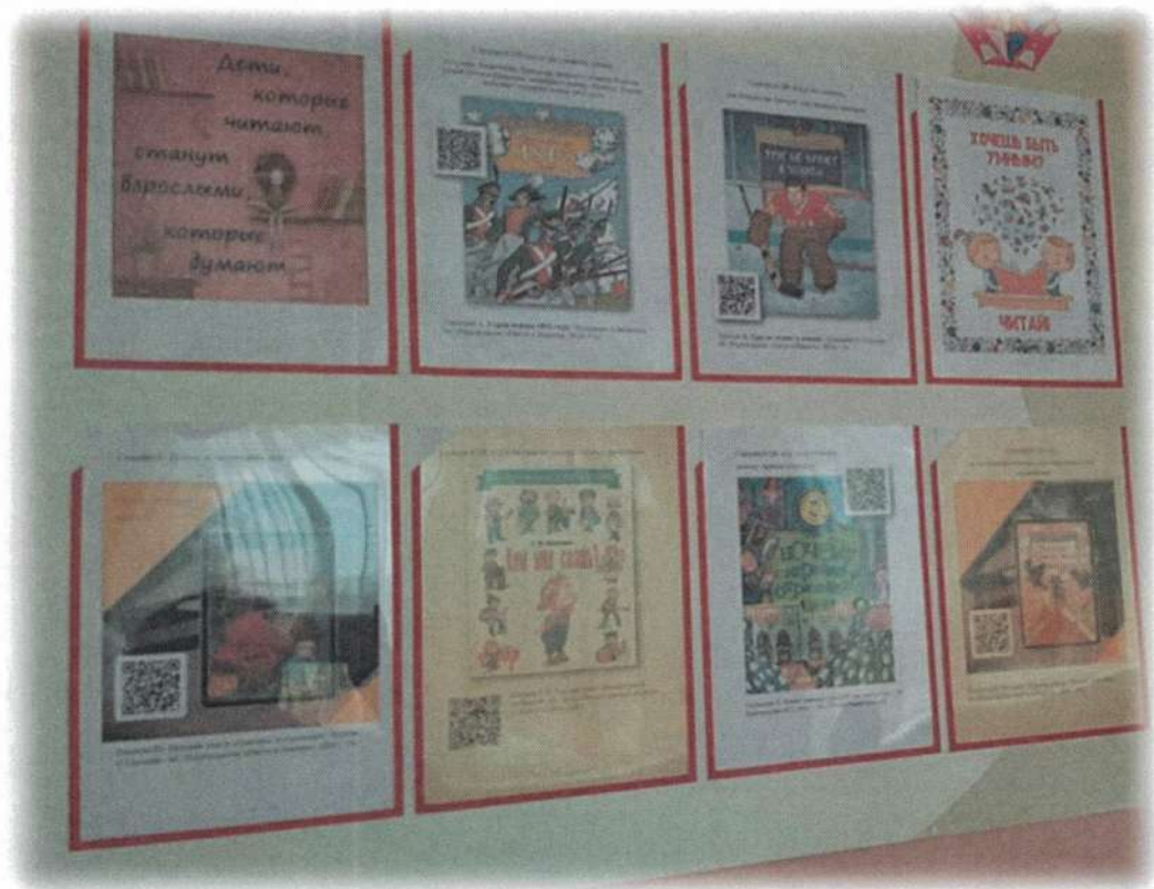
Электронная библиотечка с использованием QR-кодовой технологии в рекреации начальной школы (стенд со сменными кармашками)