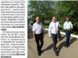
В рамках образовательного проекта «Саргазинская школа» участники собрали «облепиху» для изготовления «облепихи».