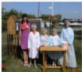
Былки, ознакомились с программой, демонстрирует технологический процесс. В саду, среди созревающих «облепихи», участники собрали «облепиху» для изготовления «облепихи».