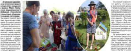
В рамках образовательного проекта «Саргазинская школа» участники собрали «облепиху» для изготовления «облепихи».