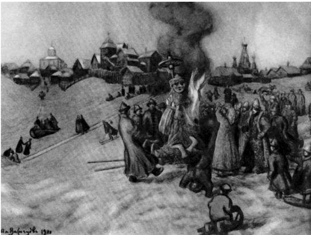
Апполинарий Васнецов «Сжигание чучела Масленицы». 1920 г.