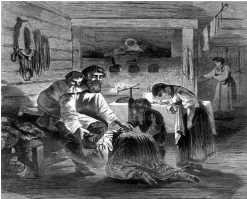
К. Крыжановский «Масленица. Прощеный день в крестьянской семье».