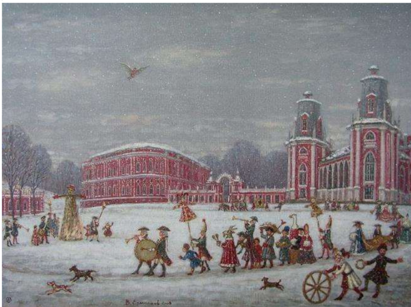
Виталий Ермолаев «Масленица в Царицыно». 2008 г.