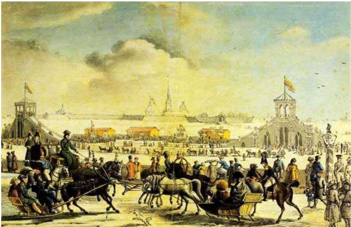
Н. Серракаприола «Катальные горы на большой Неве» 1817 г.