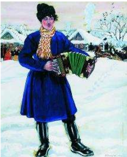
Борис Кустодиев "Масленица" 1919 г.