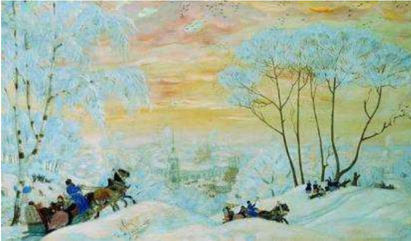
Борис Кустодиев "Масленица" 1920 г.