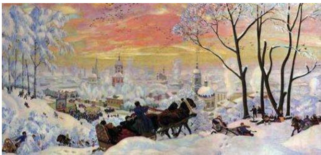
Борис Кустодиев «Масленица» 1916 г.