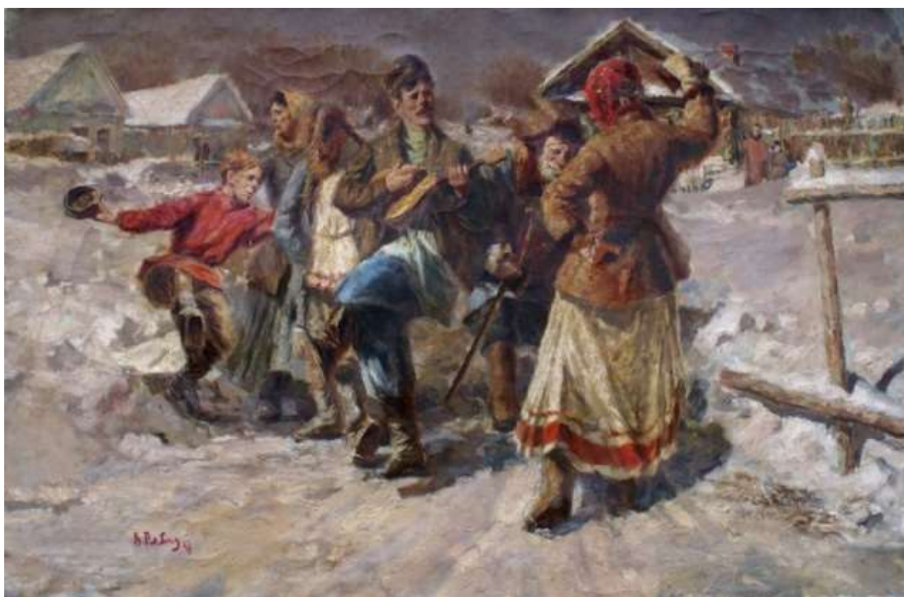
Василий Рябинин «Масленица» 1947 г.