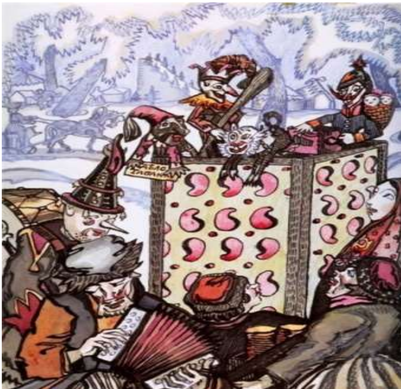
Сергей Судейкин «Масленичный Петрушка». 1910-е г.