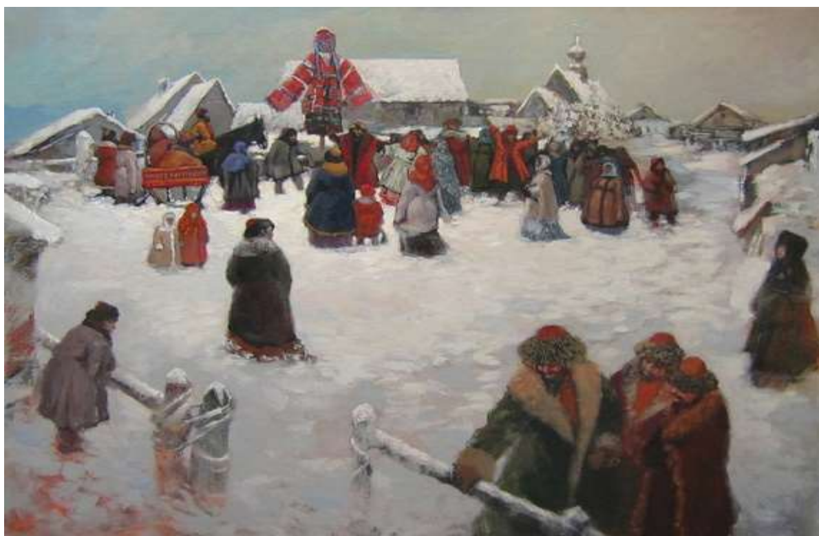
Владимир Рябчиков «Масленица». 2008 г.