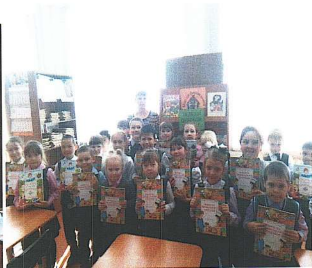
Посвящение в читатели