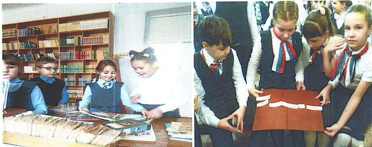
Подборка книг для обучающихся