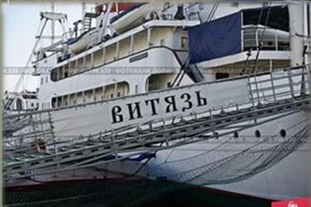
Трап судна «Витязь» у причала музея Мирового океана. Калининград