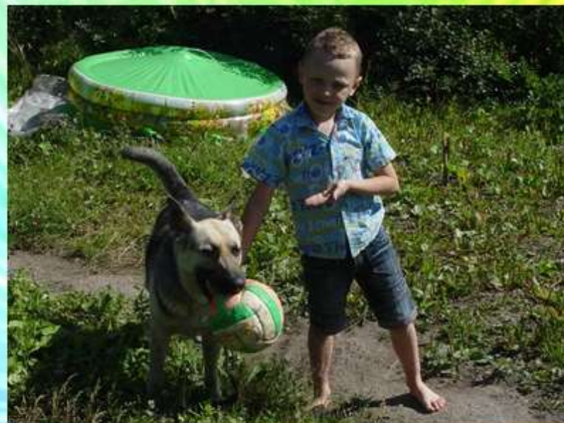
Это моя собака Эльза