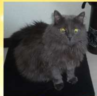
Я и мой кот Григорий.