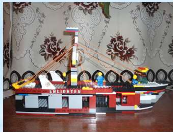
«Корабль с флагом»