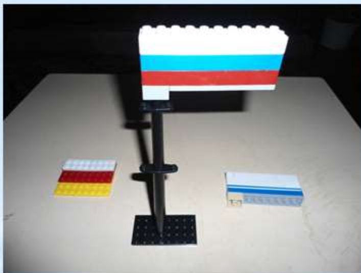
Флаг Российской Федерации